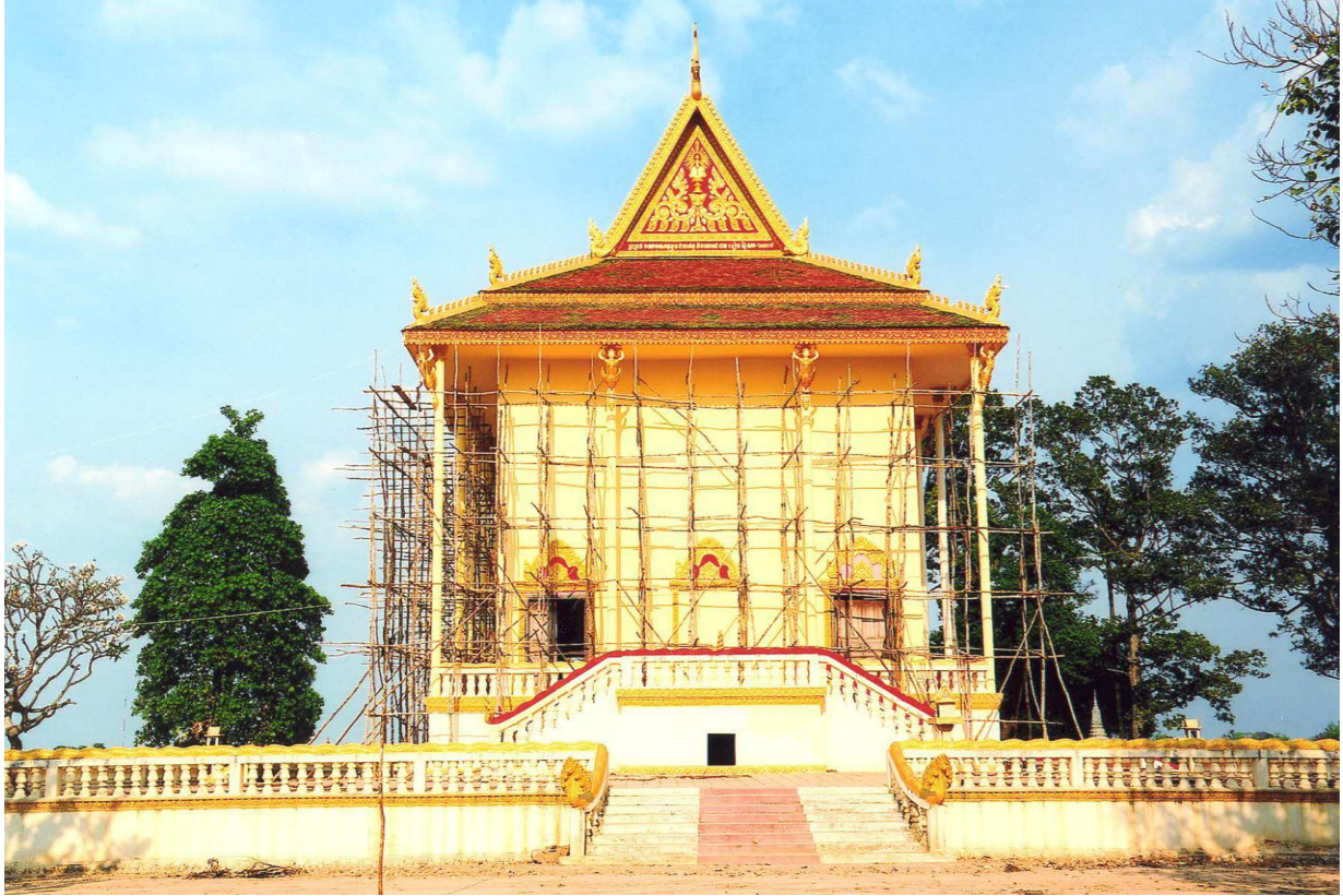
ឯកឧត្តម ជា ចាន់តូ ទេសាភិបាលធនាគារជាតិនៃកម្ពុជា អញ្ជើញចុះពិនិត្យមើលសមិទ្ធផលនានានៅវត្តតាំងក្រសៅ ឃុំតាំងក្រសៅ ស្រុកប្រាសាទសំបូរ ខេត្តកំពង់ធំ ថ្ងៃទី១៦ ខែកុម្ភៈ ឆ្នាំ២០១៣