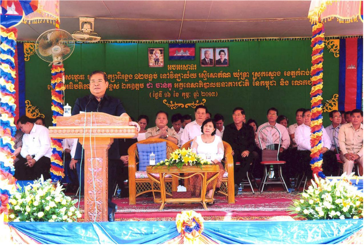
ឯកឧត្តម ជា ចាន់តូ ទេសាភិបាលធនាគារជាតិនៃកម្ពុជា និងលោកជំទាវ ខៀវ ស៊ីណា អញ្ជើញជាអធិបតីក្នុង ពិធីសម្ពោធអគារសិក្សាពីរខ្នង ១២ បន្ទប់ នៅវិទ្យាល័យស៊ីសោភ័ណ្ណ ឃុំទ្រា ស្រុកស្ទឹង ខេត្តកំពង់ចាម ថ្ងៃទី១៦ ខែកុម្ភៈ ឆ្នាំ២០១៣