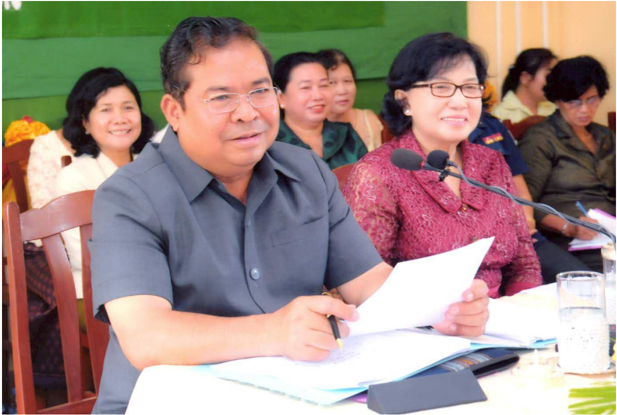
ឯកឧត្តម ជា ចាន់តូ ទេសាភិបាលធនាគារជាតិនៃកម្ពុជា និងលោកជំទាវ ខៀវ ស៊ីណា អញ្ជើញជាអធិបតីក្នុងពិធីអបអរសាទរខួបអនុស្សាវរីយ៍លើកទី១០២ នៃទិវាអន្តរជាតិនារី ៨ មីនា ២០១៣ នៅឃុំតាំងក្រសាំង ស្រុកសន្ទុក ខេត្តកំពង់ធំ ថ្ងៃទី២ ខែមីនា ឆ្នាំ២០១៣