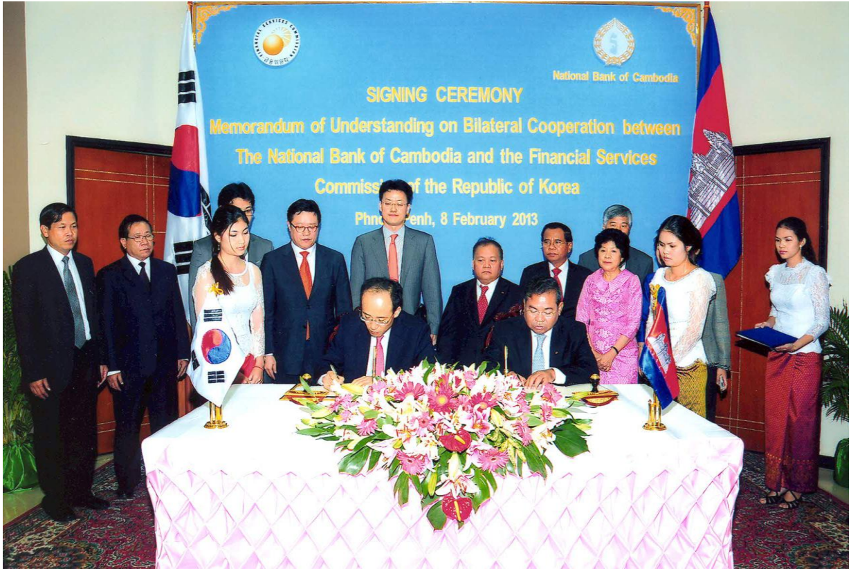
ពិធីចុះហត្ថលេខាលើអនុស្សាវរណៈយល់គ្នា រវាងធនាគារជាតិនៃកម្ពុជា ជាមួយនិងគណៈកម្មការសេវាហិរញ្ញវត្ថុកូរ៉េ ថ្ងៃទី៨ ខែកុម្ភៈ ឆ្នាំ២០១៣