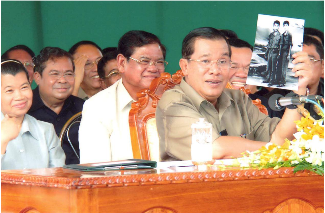
ឯកឧត្តម ជា ចាន់តូ ទេសាភិបាលធនាគារជាតិនៃកម្ពុជា ក្នុងពិធីចែកប័ណ្ណកម្មសិទ្ធិដីធ្លី ជូនប្រជាពលរដ្ឋនៅក្នុង ស្រុកព្រៃនប់ ខេត្តព្រះសីហនុ និងស្រុកអណ្តូងមាស ខេត្តរតនគិរី ក្រោមអធិបតីភាពសម្តេចអគ្គមហាសេនាបតី តេជោ ហ៊ុន សែន នាយករដ្ឋមន្ត្រីនៃព្រះរាជាណាចក្រកម្ពុជា កាលពីថ្ងៃទី២ និងទី៧ ខែធ្នូ ឆ្នាំ២០១២