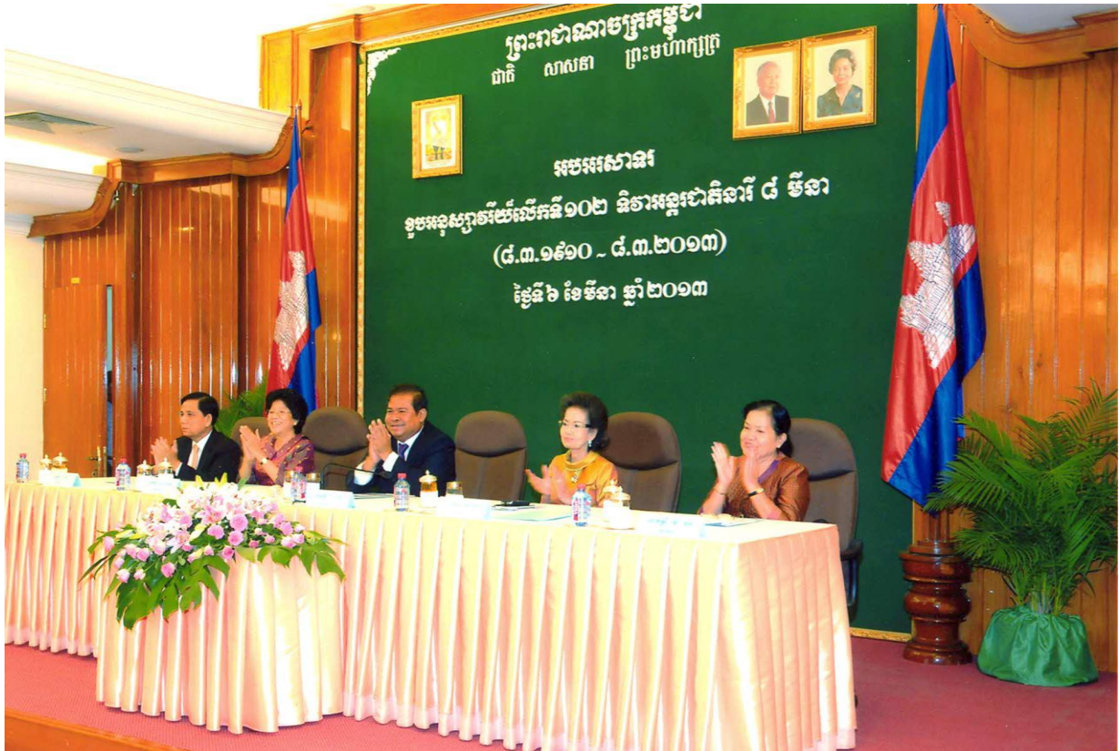
ឯកឧត្តម ជា ចាន់តូ ទេសាភិបាលធនាគារជាតិនៃកម្ពុជា អញ្ជើញជាអធិបតី ក្នុងពិធីអបអរសាទរខួបអនុស្សាវរីយ៍លើកទី១០២ នៃទិវាអន្តរជាតិទារី ៨ មីនា ២០១៣ ថ្ងៃទី៦ ខែមីនា ឆ្នាំ២០១៣