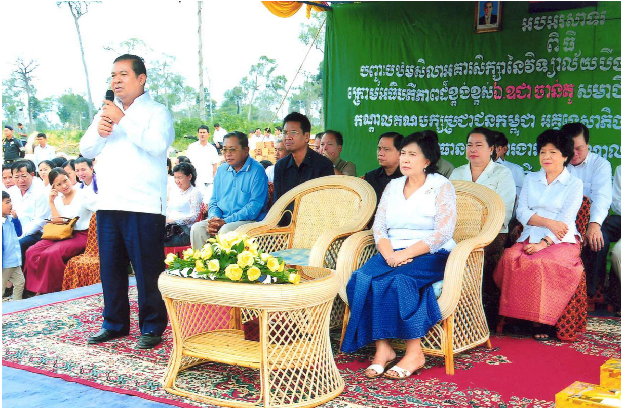
ឯកឧត្តម ជា ចាន់តូ ទេសាភិបាលធនាគារជាតិនៃកម្ពុជា និងលោកជំទាវ ខៀវ ស៊ីណា អញ្ជើញជាអធិបតីក្នុងពិធីបញ្ចុះបឋមសិលាវិទ្យាល័យ បឹងល្វាលើ ឃុំបឹងល្វា ស្រុកសន្ទុក ខេត្តកំពង់ធំ ថ្ងៃទី៨ ខែមករា ឆ្នាំ២០១៣