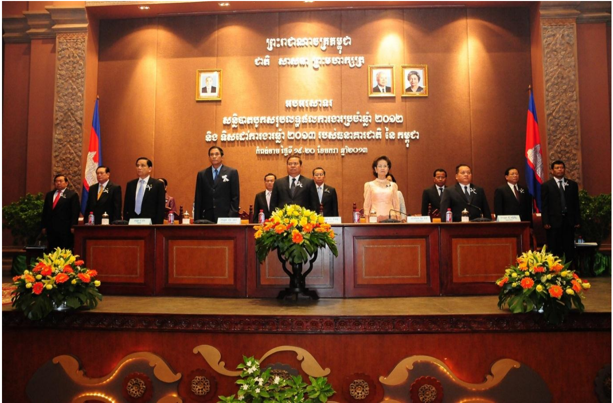
ពិធីអបអរសាទរ សន្និបាតបូកសរុបលទ្ធផលការងារប្រចាំឆ្នាំ២០១២ និងទិសដៅការងារឆ្នាំ២០១៣ របស់ ធនាគារជាតិនៃកម្ពុជា ក្រោមអធិបតីភាពដ៏ខ្ពង់ខ្ពស់ ឯកឧត្តម ជា ចាន់តូ ទេសាភិបាលធនាគារជាតិនៃកម្ពុជា និងឯកឧត្តម ហ៊ុន ណេង អភិបាលនៃគណៈអភិបាលខេត្តកំពង់ចាម ថ្ងៃទី១៩-២០ ខែមករា ឆ្នាំ២០១៣