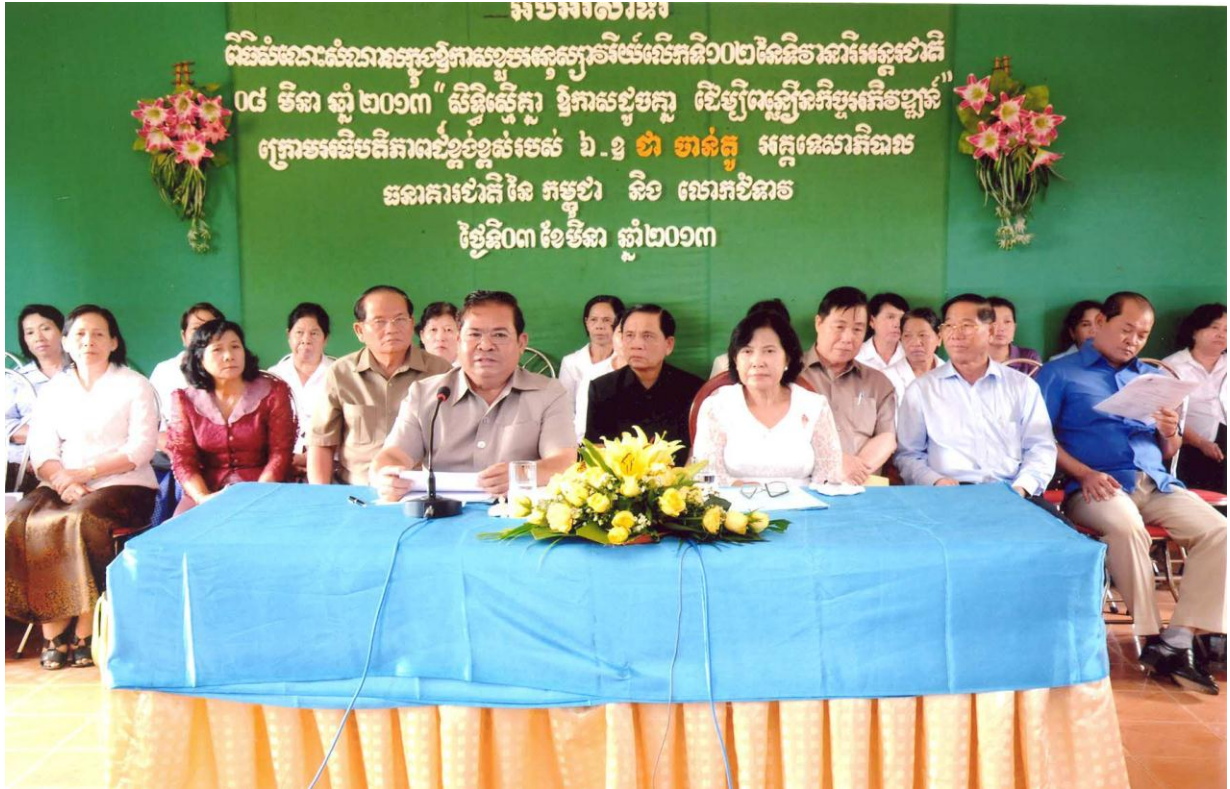
ឯកឧត្តម ជា ចាន់តូ ទេសាភិបាលធនាគារជាតិនៃកម្ពុជា និងលោកជំទាវ ខៀវ ស៊ីណា អញ្ជើញជាអធិបតីក្នុងពិធីអបអរសាទរខួបអនុស្សាវរីយ៍លើកទី១០២ នៃទិវាអន្តរជាតិនារី ៨ មីនា ២០១៣ នៅស្រុកស្ទឹង ខេត្តកំពង់ធំ ថ្ងៃទី៣ ខែមីនា ឆ្នាំ២០១៣