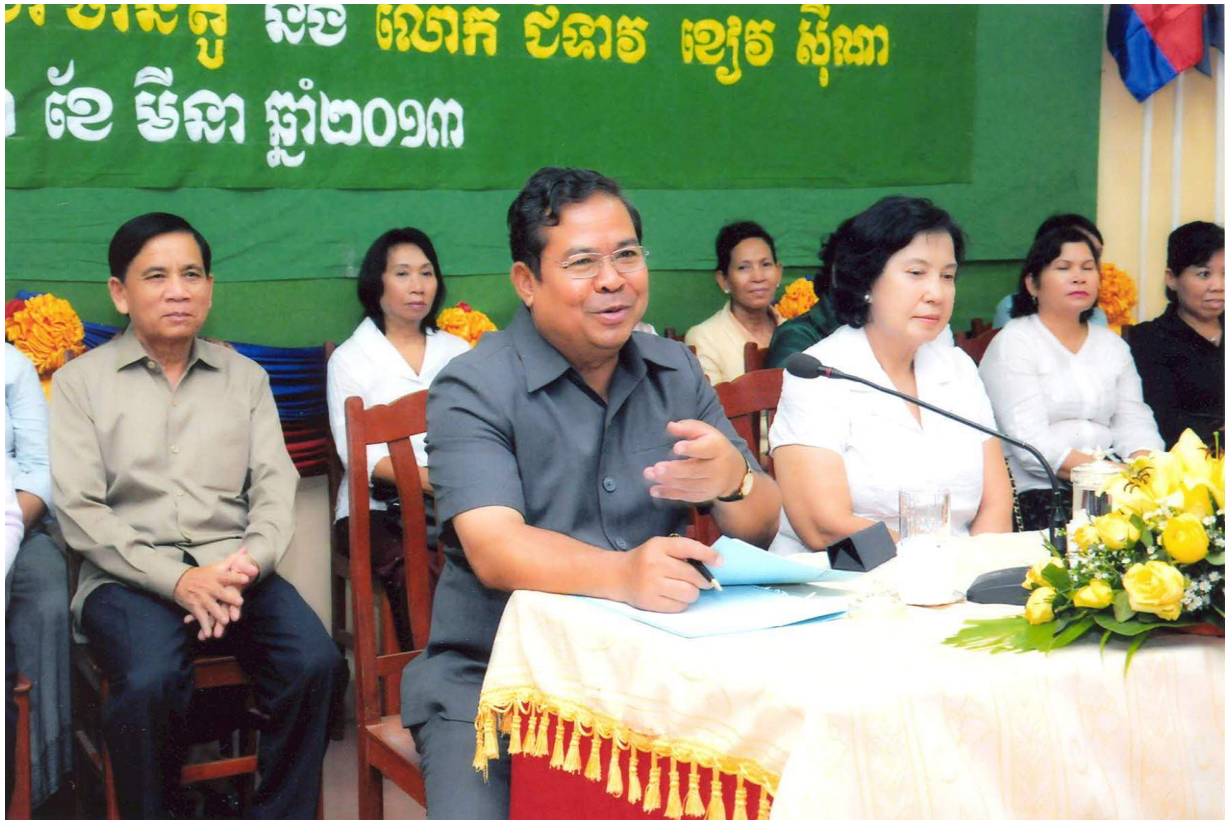
ឯកឧត្តម ជា ចាន់តូ ទេសាភិបាលធនាគារជាតិនៃកម្ពុជា និងលោកជំទាវ ខៀវ ស៊ីណា អញ្ជើញជួបសំណេះសំណាលជាមួយក្រុមយុវជនស្ម័គ្រចិត្តរបស់សម្តេចអគ្គមហាសេនាបតីតេជោ ហ៊ុន សែន នាយករដ្ឋមន្ត្រីនៃព្រះរាជាណាចក្រកម្ពុជា នៅឃុំតាំងក្រសាំង ស្រុកសន្ទុក ខេត្តកំពង់ធំ ថ្ងៃទី២ ខែមីនា ឆ្នាំ២០១៣