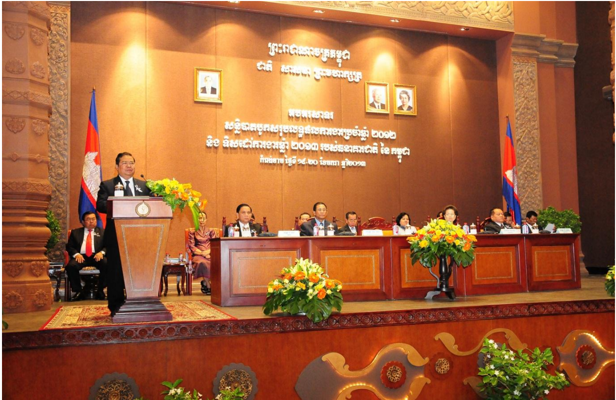
ឯកឧត្តម ជា ចាន់តូ ទេសាភិបាលធនាគារជាតិនៃកម្ពុជា ថ្លែងសុន្ទរកថា ក្នុងពិធីសន្និបាត បូកសរុបលទ្ធផលការងារប្រចាំឆ្នាំ២០១២ និងទិសដៅការងារឆ្នាំ២០១៣ របស់ធនាគារជាតិនៃកម្ពុជា នៅខេត្តកំពង់ចាម ថ្ងៃទី១៩ - ២០ ខែមករា ឆ្នាំ២០១៣