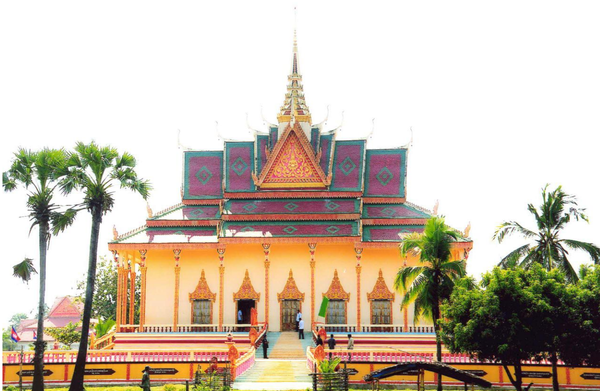
ឯកឧត្តម ជា ចាន់តូ ទេសាភិបាលធនាគារជាតិនៃកម្ពុជា អញ្ជើញចុះពិនិត្យមើលសមិទ្ធផលនានានៅវត្តស្តីជើង និងវត្តស្វាយរមៀតខាងត្បូង ក្នុងស្រុកស្លោង ខេត្តកំពង់ធំ ថ្ងៃទី១៣ ខែមករា ឆ្នាំ២០១៣