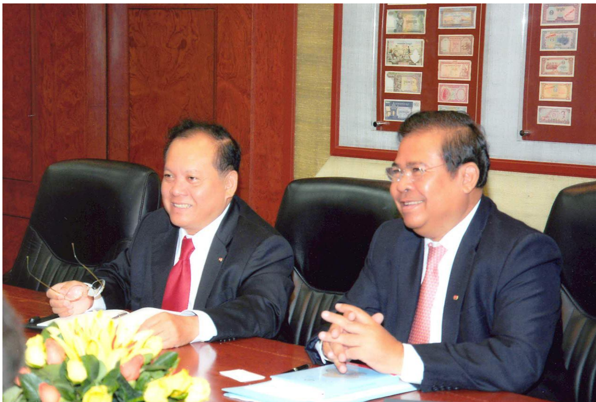
ឯកឧត្តម ជា ចាន់តូ ទេសាភិបាលធនាគារជាតិនៃកម្ពុជា អនុញ្ញាតឱ្យក្រុមបេសកកម្ម IMF ដឹកនាំដោយលោកស្រី Jahanara Zaman អញ្ជើញចូលជួបសម្តែងការគួរសម និងពិភាក្សាការងារ ថ្ងៃទី១១ ខែមីនា ឆ្នាំ២០១៣