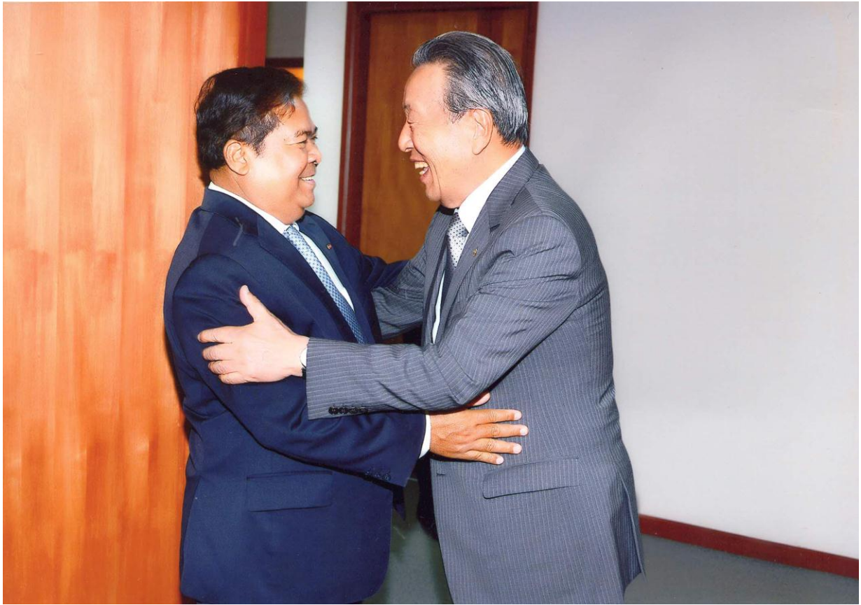
ឯកឧត្តម ជា ចាន់តូ អគ្គទេសាភិបាលធនាគារជាតិនៃកម្ពុជា អនុញ្ញាតឲ្យប្រតិភូ សមាជិកក្រុមប្រឹក្សាភិបាលធនាគារជប៉ុន (Marohan Bank) ដឹកនាំដោយលោកបណ្ឌិត Han Change Woo ចូលជួបសម្តែងការគួរសម និងពិភាក្សាការងារ នាថ្ងៃទី១៧ ខែកក្កដា ឆ្នាំ២០១៤