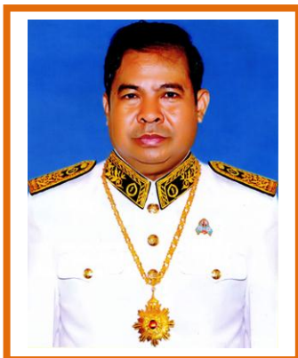
ឯកឧត្តម ជា ចាន់តូ