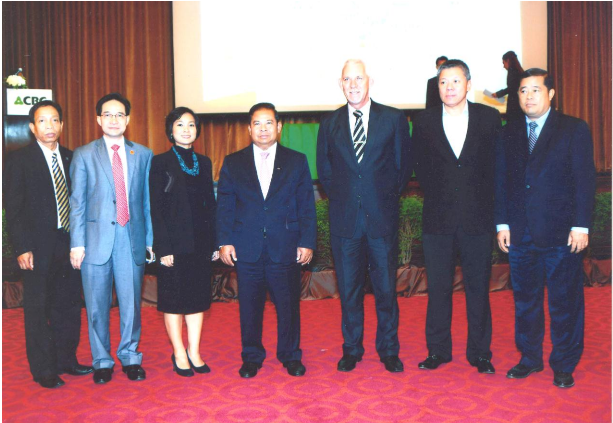
ឯកឧត្តម ជា ចាន់តូ អគ្គទេសាភិបាលធនាគារជាតិនៃកម្ពុជា អញ្ជើញជាអធិបតីក្នុងវេទិកា ស្តីពី ទស្សនៈវិស័យនៃតម្រូវការឥណទានឆ្នាំ២០២០ នាថ្ងៃទី៥ ខែមីនា ឆ្នាំ២០១៤