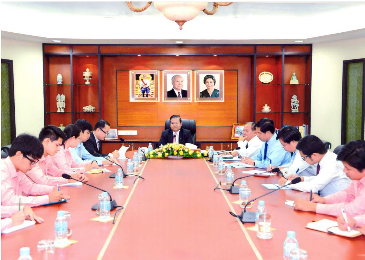
ឯកឧត្តម ជា ចាន់តូ អគ្គទេសាភិបាលធនាគារជាតិនៃកម្ពុជា អនុញ្ញាតឲ្យយុវជននាវាអាស៊ីអាគ្នេយ៍ ចូលរួមសម្តែងការគូរសម និងពិភាក្សាការងារ នាថ្ងៃទី២៩ ខែសីហា ឆ្នាំ២០១៤