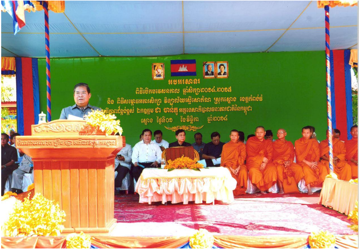
ឯកឧត្តម ជា ចាន់តូ អគ្គនាយកបាលធនាគារជាតិនៃកម្ពុជា អញ្ជើញជាអធិបតីដ៏ខ្ពង់ខ្ពស់ ក្នុងពិធីសម្ពោធអគារសិក្សា វិទ្យាល័យស្ទើរសោភ័ណ ស្រុកស្ទោង ខេត្តកំពង់ធំ នាថ្ងៃទី១ ខែវិច្ឆិកា ឆ្នាំ២០១៤