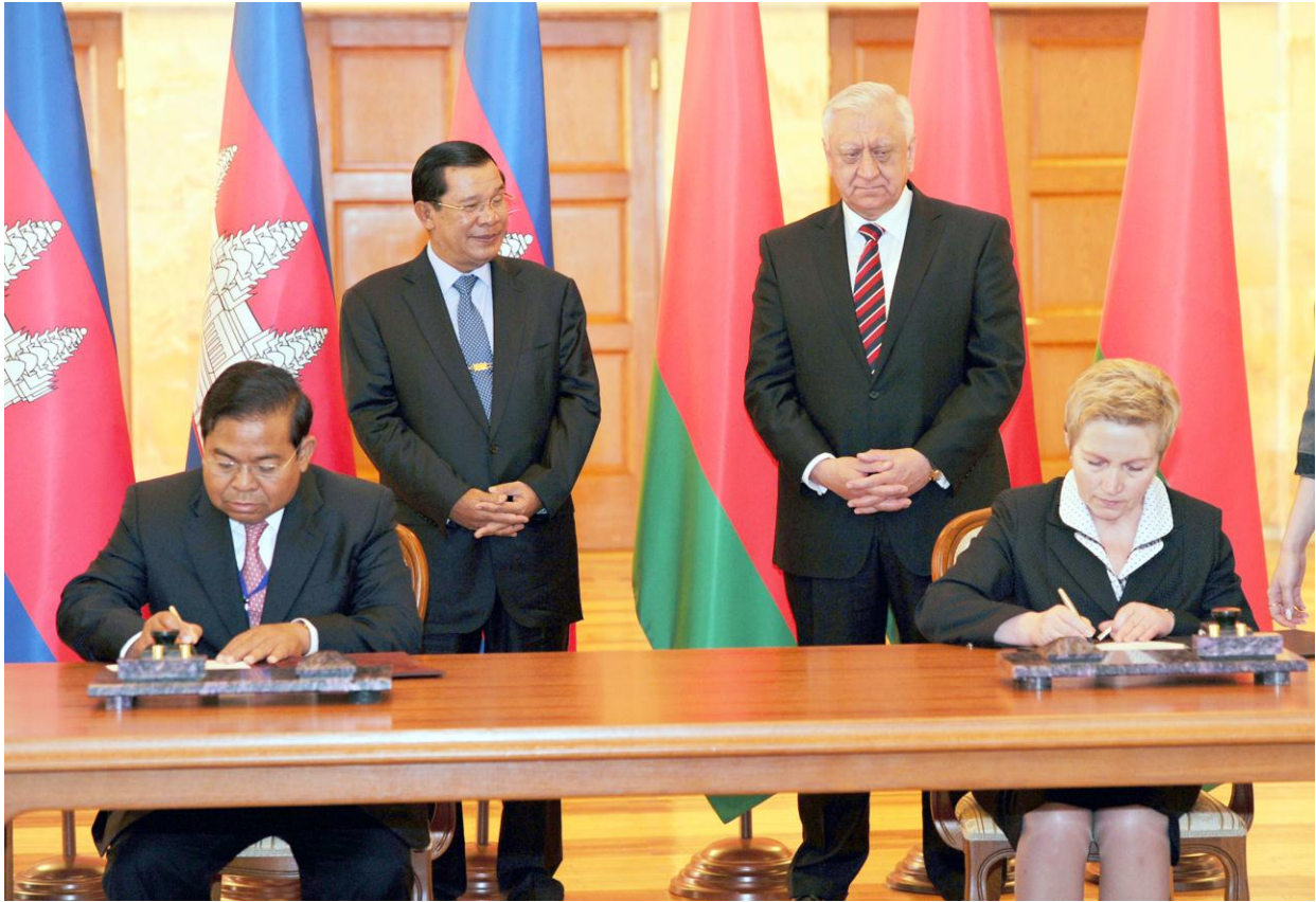
ឯកឧត្តម ជា ចាន់តូ អគ្គទេសាភិបាលធនាគារជាតិនៃកម្ពុជា ក្នុងពិធីចុះហត្ថលេខាលើអនុស្សរណៈយល់គ្នារវាងធនាគារជាតិនៃកម្ពុជាជាមួយនិងធនាគារកណ្តាល Belarus ថ្ងៃទី២៥ ខែមេសា ឆ្នាំ២០១៤