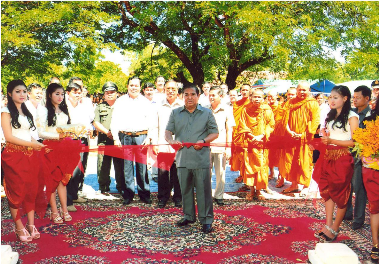
ឯកឧត្តម ជា ចាន់តូ អគ្គនាយកបាលធនាគារជាតិនៃកម្ពុជា អញ្ជើញជាអធិបតីដ៏ខ្ពង់ខ្ពស់ ក្នុងពិធីកាត់ខ្សែបូដាក់ឲ្យប្រើប្រាស់ជាផ្លូវការអគារសិក្សា វិទ្យាល័យរស្មីសោភ័ណ ស្រុកស្នោង ខេត្តកំពង់ធំ នាថ្ងៃទី១ ខែវិច្ឆិកា ឆ្នាំ២០១៤