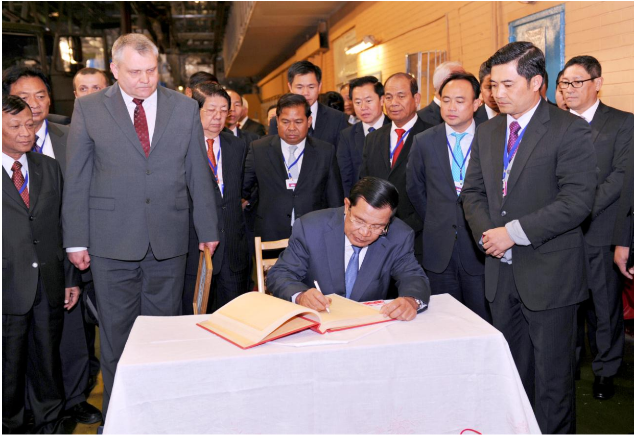
ឯកឧត្តម ជា ចាន់តូ អគ្គទេសាភិបាលធនាគារជាតិនៃកម្ពុជា បានអញ្ជើញចូលរួមក្នុង ទស្សនកិច្ចផ្លូវការជាមួយសម្តេចអគ្គមហាសេនាបតីតេជោ ហ៊ុន សែន នាយករដ្ឋមន្ត្រីនៃព្រះរាជាណាចក្រកម្ពុជា ទៅកាន់ប្រទេស Belarus កាលពីថ្ងៃទី២០-២៥ ខែមេសា ឆ្នាំ២០១៤