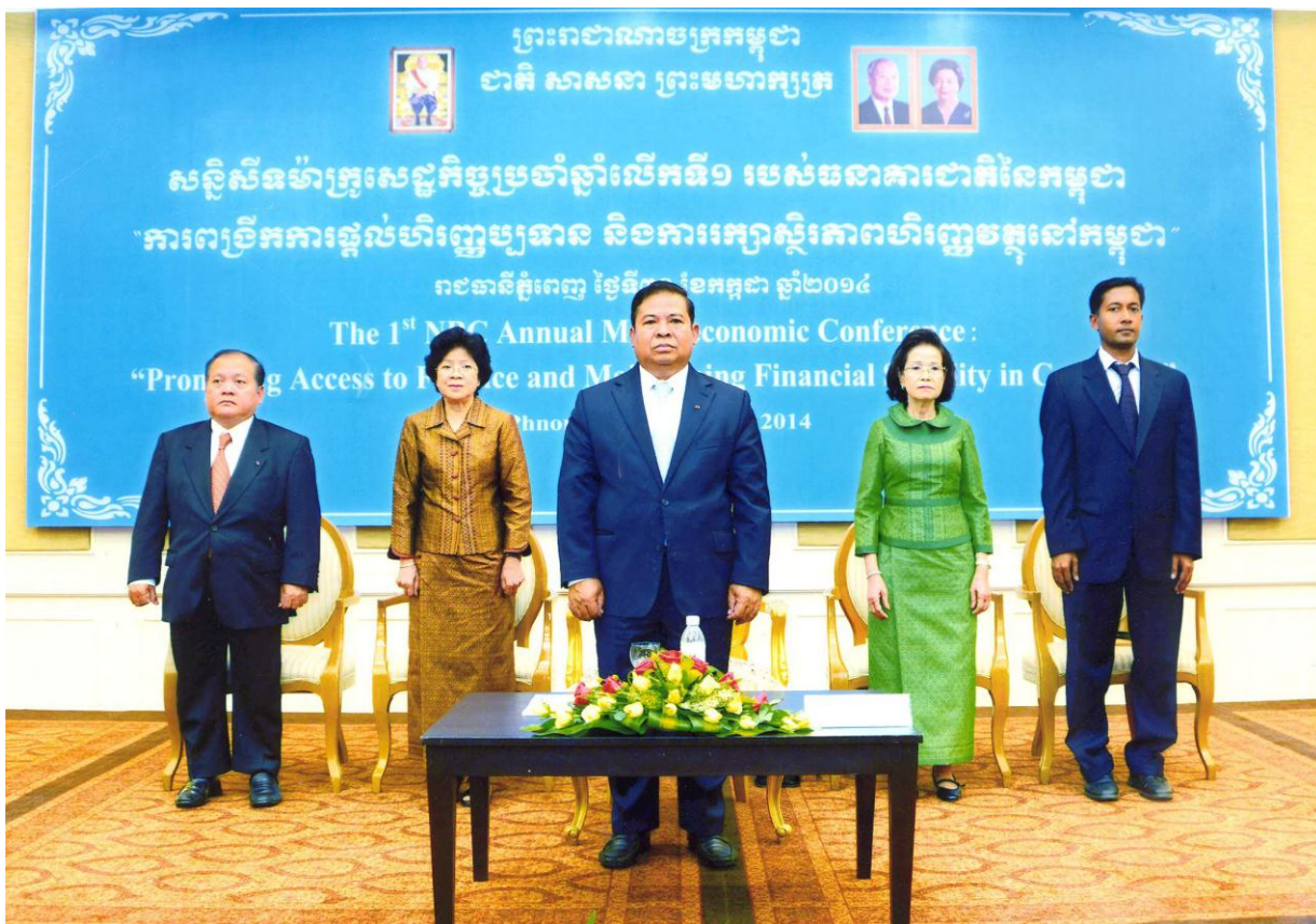
ឯកឧត្តម ជា ចាន់តូ អគ្គនាយកប្រតិបត្តិធនាគារជាតិនៃកម្ពុជា អញ្ជើញជាអធិបតីខ្ពង់ខ្ពស់ក្នុងពិធីសន្និសីទម៉ាក្រូសេដ្ឋកិច្ចប្រចាំឆ្នាំលើកទី១ របស់ធនាគារជាតិនៃកម្ពុជា នាថ្ងៃទី៣០ ខែកក្កដា ឆ្នាំ២០១៤