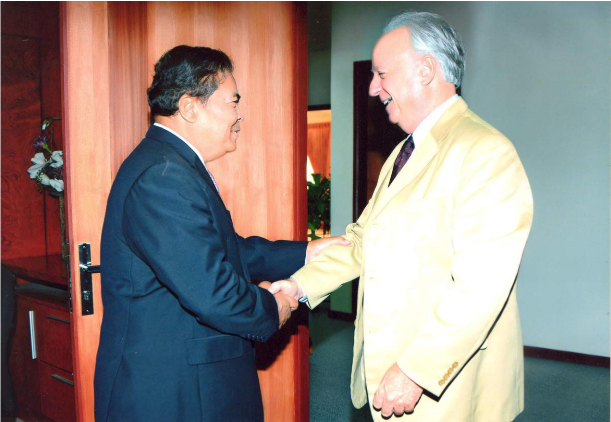
ឯកឧត្តម ជា ចាន់តូ អគ្គទេសាភិបាលធនាគារជាតិនៃកម្ពុជា អនុញ្ញាតឲ្យប្រតិភូ CDR ដឹកនាំដោយលោក Larry Strange អតីតនាយកប្រតិបត្តិ CDR ចូលជួបសម្តែងការគួរសម និងពិភាក្សាការងារ នាថ្ងៃទី២៨ ខែសីហា ឆ្នាំ២០១៤