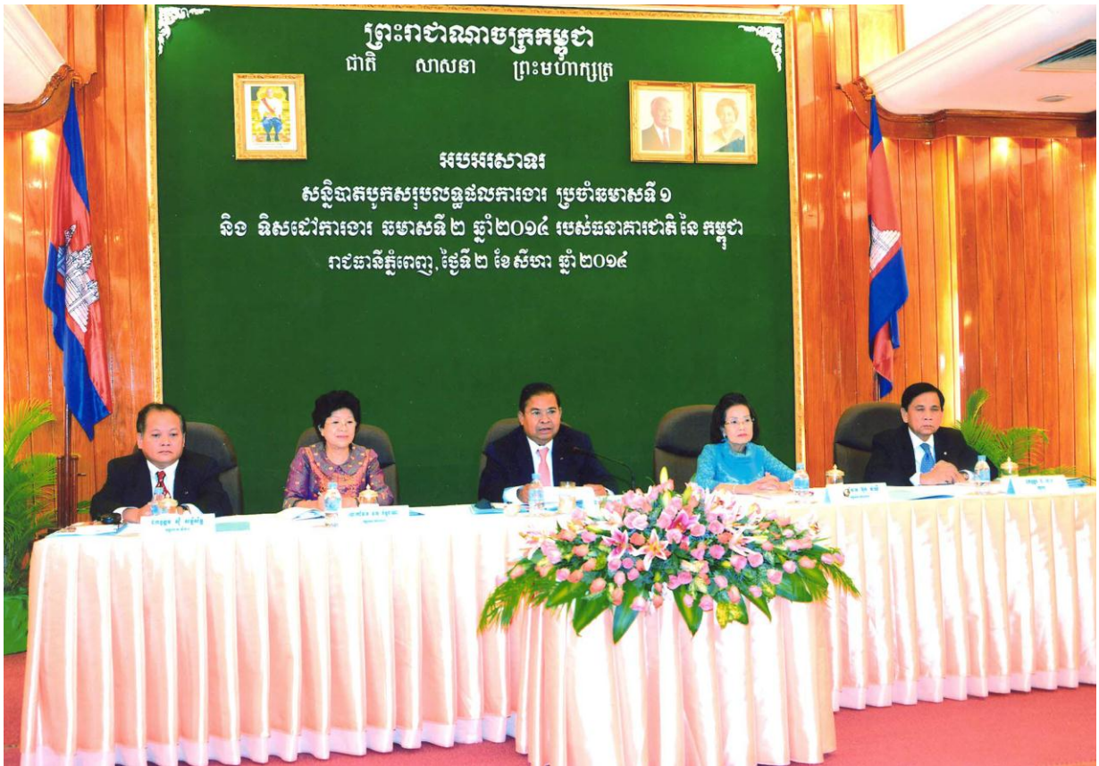
ឯកឧត្តម ជា ចាន់តូ អគ្គទេសាភិបាលធនាគារជាតិនៃកម្ពុជា អញ្ជើញជាអធិបតីដ៏ខ្ពង់ខ្ពស់ក្នុងពិធីអបអរសាទរសន្និបាតបុគ្គលិកសរុបលទ្ធផលការងារប្រចាំឆមាសទី ១ និងទិសដៅការងារឆមាសទី ២ ឆ្នាំ ២០១៤ របស់ធនាគារជាតិនៃកម្ពុជា នាថ្ងៃទី ២ ខែ សីហា ឆ្នាំ ២០១៤