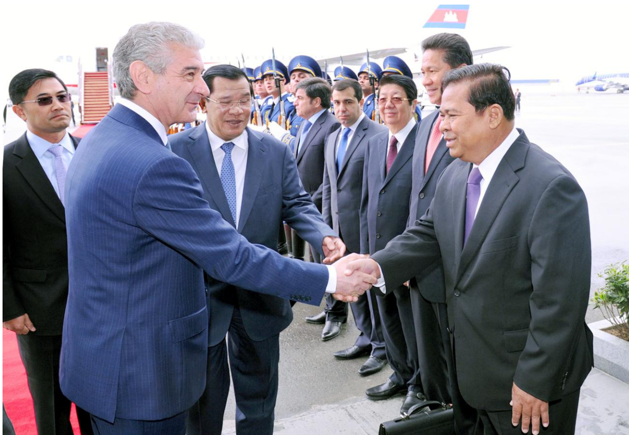
ឯកឧត្តម ជា ចាន់តូ អគ្គនាយកប្រចាំធនាគារជាតិនៃកម្ពុជា បានអញ្ជើញចូលរួមក្នុង ដំណើរទស្សនកិច្ចផ្លូវការជាមួយសម្តេចអគ្គមហាសេនាបតីតេជោ ហ៊ុន សែន នាយករដ្ឋមន្ត្រីនៃ ព្រះរាជាណាចក្រកម្ពុជា ទៅកាន់ប្រទេស Azerbaijan កាលពីថ្ងៃទី២០-២៥ ខែមេសា ឆ្នាំ២០១៤