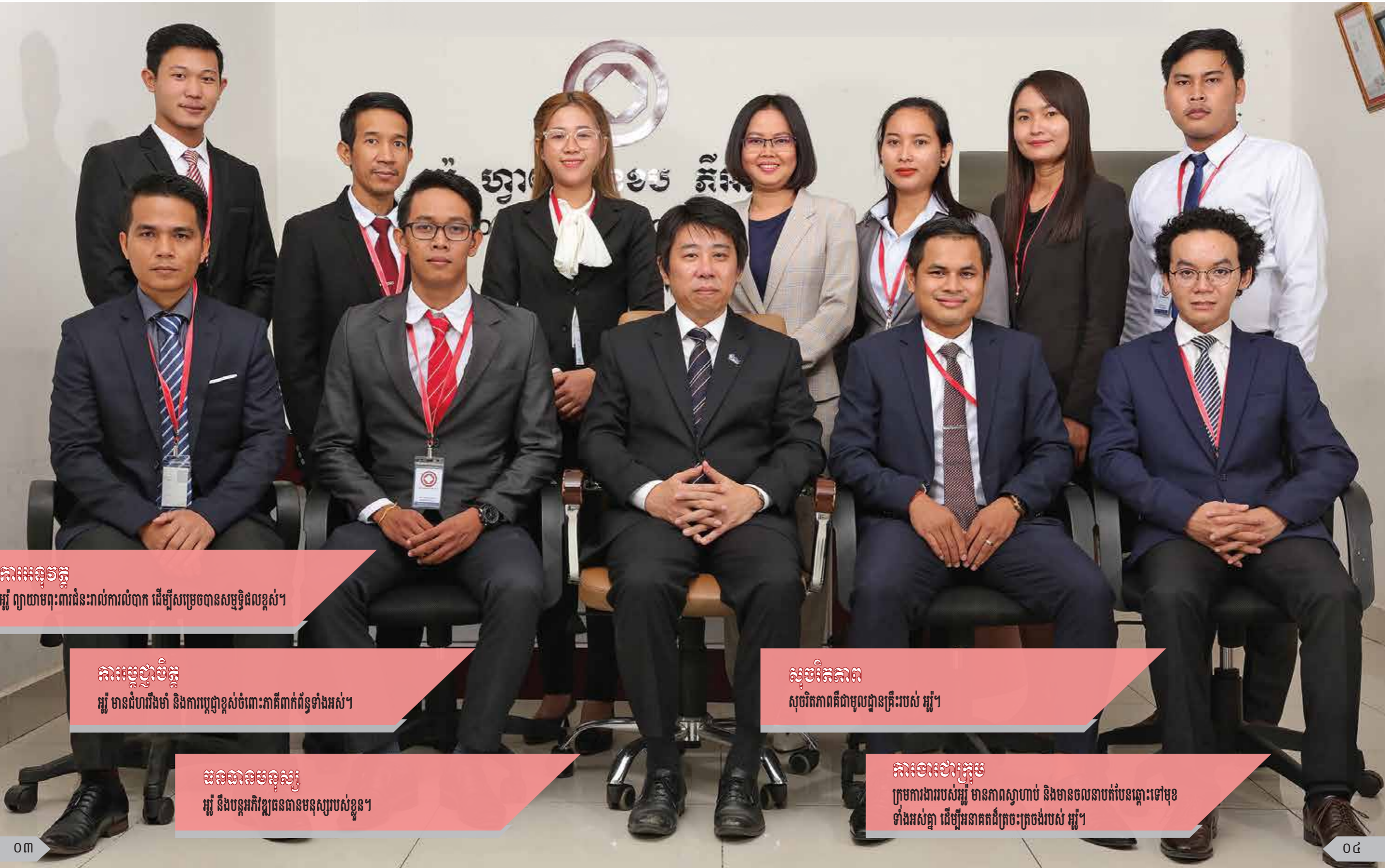
គណៈអនុវត្ត អ្នក ព្យាយាមពុះពារជំនះរាល់ការលំបាក ដើម្បីសម្រេចបានសម្បូរផលខ្ពស់។